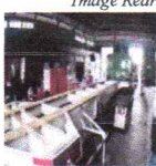
Foto Kanan Image right